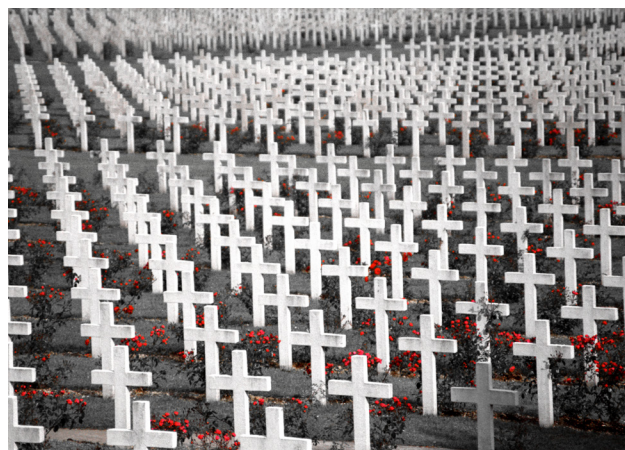
Minnesplats och kyrkogård i Verdun, där drygt 700 000 franska och tyska soldater förlorade livet under ett av de värsta slagen under första världskriget.

Ju längre detta pågick, och ju mer jag utvecklades från barn till vuxen man, desto mer trängande blev frågan: ”Hur är det möjligt?” Hur är det möjligt att miljontals män stannar i skyttegravarna för att döda oskyldiga män från andra nationer och själva bli dödade, och på det sättet orsaka föräldrar, hustrur och vänner den djupaste tänkbara smärta? [...] Hur är det möjligt att båda sidor tror att de kämpar för fred och frihet?